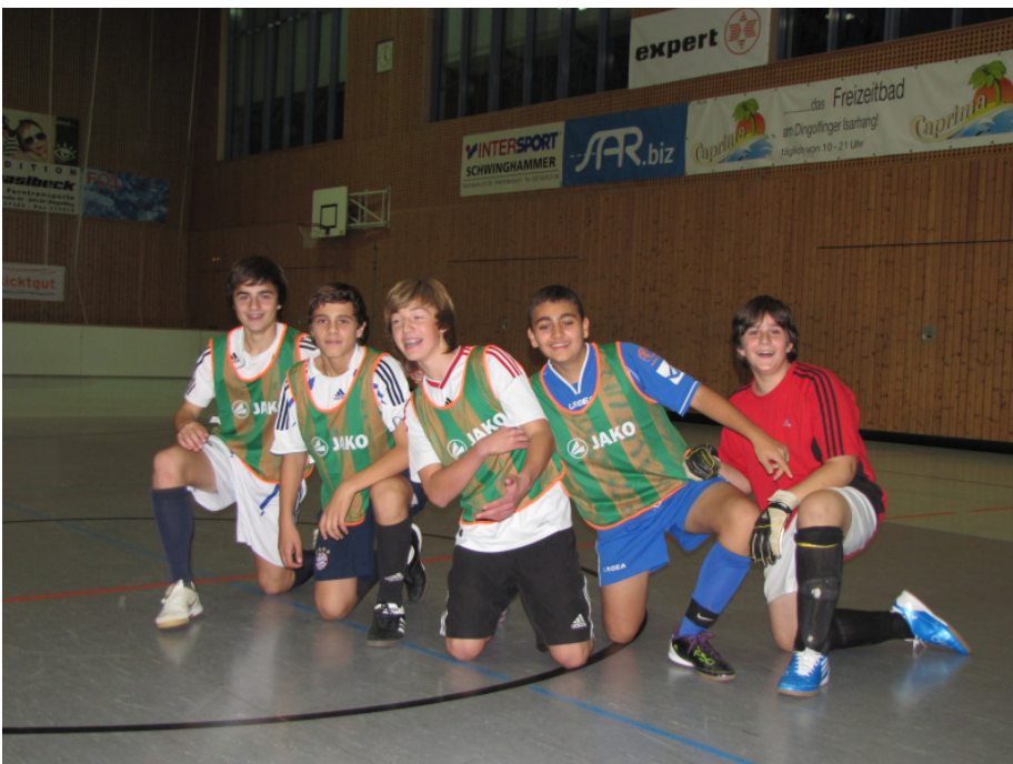
Eines der Dingolfinger buntkickgut - Teams

Am 6. November fand in Dingolfing-Höll-Ost der 3. Herbst-Cup für junge Straßenfußballer statt.