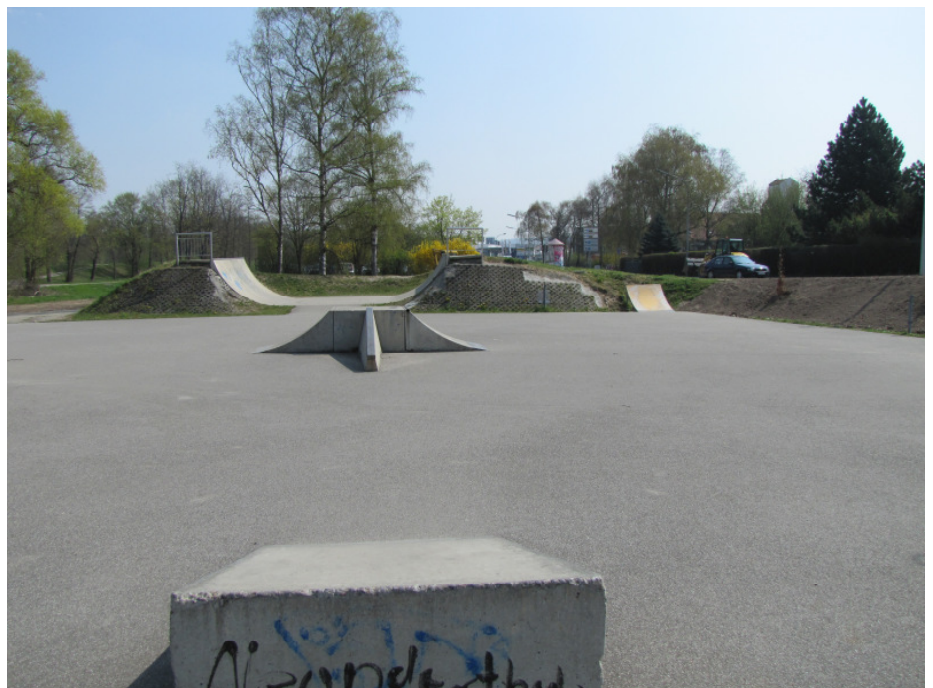
Aktuelles Bild des Skateparks in Dingolfing

Der lange und intensive Prozess der Beteiligung bietet eine gute Diskussionsgrundlage für die weitere Vorgehensweise und garantiert eine nachhaltige langfristige Beteiligung der Interessierten am Prozess der Umgestaltung des Skateparks.