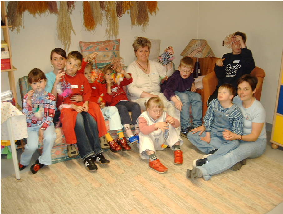
Gruppe der OBA

2010 – das Jahr eines Neubeginns. Lange hat es gedauert, aber zum 01.01.2010 wurde die neue Richtlinie zur Förderung der OBA-Dienste geändert. Mehr Zuschüsse für dringend benötigtes Personal ermöglichten den Ausbau des Dienstes bei der Caritas Landau, der schon seit 01.01.1996 besteht und für den gesamten Landkreis Dingolfing-Landau zuständig war und ist.