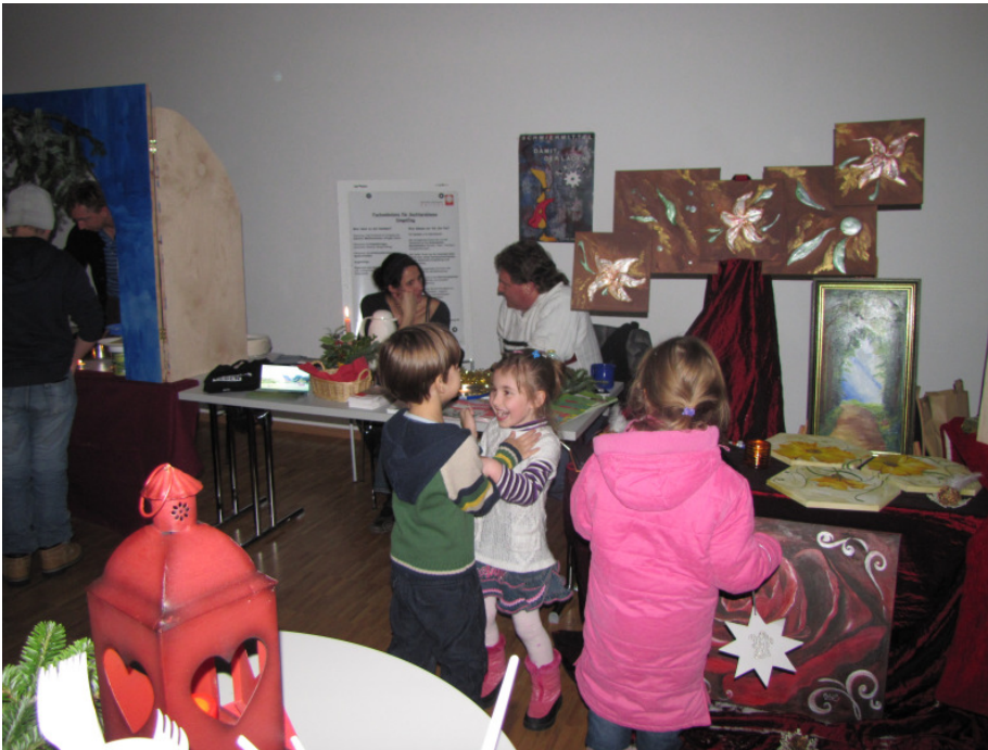
Buntes Treiben am ersten Weihnachtsbasar im Stadtteilzentrum Nord

Am Donnerstag den 09.12.2010 fand erstmalig ein Weihnachtsbasar im Stadtteilzentrum Nord statt. Das Quartiermanagement Soziale Stadt Dingolfing, das Jugendzentrum Dingolfing, Artec Projectum, der Frauentreff, die Caritas Fachambulanz für Suchtprobleme, die offene Behindertenarbeit des Caritasverbandes Isar/ Vils, Streetwork Stadt Dingolfing, die Mittagsbetreuung der Grundschule St. Josef, der türkische Elternbeirat e.V., das Team der Kupferkanne und auch einige aktive BürgerInnen hatten ihre Waren im Veranstaltungssaal des Stadtteilzentrum Nord präsentiert.