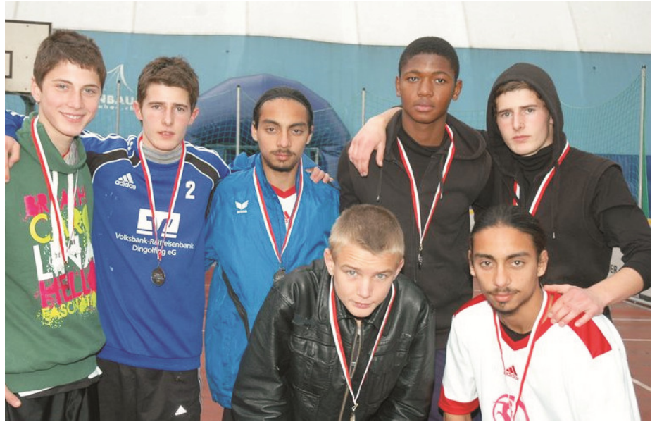
Dingolfinger buntkickgut - Team in der Schweiz

Im Rahmen eines im Mai stattgefundenen international ausgerichteten Straßenfußballturniers im Olympiapark München (buntkickgutopen) entstand für Streetwork-Stadt Dingolfing und Dingolfinger Jugendliche der Kontakt zum Schweizer Straßenfußballprojekt von buntkickgut. Über diesen Kontakt ergab sich nun für 7 Jugendliche aus Dingolfing die Gelegenheit vom 15.10.-17.10.2010 im Rahmen einer Einladung von buntkickgut Schweiz und durch die Unterstützung von Streetwork-Stadt Dingolfing am LAUREUS SWISS CUP 2010 in Luzern teilzunehmen. Im sportlichen Kräftemessen mit den Schweizer Jugendlichen, beeindruckten die Dingolfinger als einziges ausländisches Team mit einem beachtlichen 2. Platz in der Altersgruppe Ü 16. Darüberhinaus stand aber auch die gemeinsame Begegnung mit den gastgebenden Schweizer Jugendlichen aus Luzern-Emmen und ihren Betreuer Andi Hofer an diesem Wochenende im Vorder-