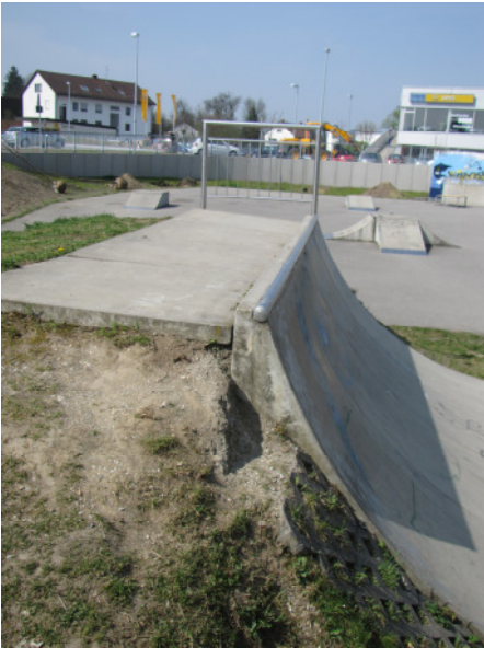
Miniramp im Dingolfinger Skatepark

In Dingolfing existiert eine Gruppe von etwa 30 aktiven Skateboardern und weiteren Funsportlern. Diese sind auf Möglichkeiten zur Ausübung ihrer sportlichen Aktivitäten angewiesen. Skateboarder sind nicht nur auf Fahrwege, sondern auch auf Hindernisse (Obstacles) angewiesen, die benutzt werden können um eine Route entsprechend mit Tricks abzufahren. Öffentlicher Raum eignet sich nur bedingt für die Sportler, da es hier oftmals zu Konflikten mit anderen Nutzergruppen (Fußgänger, Radfahrer, etc.) kommt. Die Abnutzung von Geländern, Bänken, Bordsteinkanten etc. im öffentlichen Raum ist (verständlicherweise) nicht gewünscht und die Gefährdung von anderen Verkehrsteilnehmern ebenso wenig.